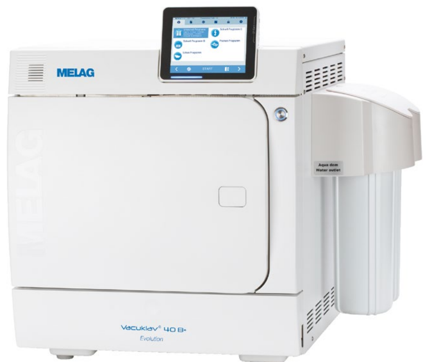
Vacuklav40B+ Evolution mit seitlich angebrachter MELAdem40

Sparen Sie Zeit und Geld, das Sie für das Beschaffen, Transportieren, Lagern und Einfüllen des destillierten oder demineralisierten Wassers in Ihren Autoklav benötigen, indem Sie Ihren Vacuklav an eine Wasser-Aufbereitungsanlage anschließen. Wenn sich in der Nähe des Autoklaven ein Wasserzu- und Wasserablauf befindet, automatisieren Sie nicht nur die Befüllung und Dosierung, sondern auch den Abfluss des verwendeten Wassers. Von der kleinen praktischen MELAdem40 über die besonders wirtschaftliche und umweltfreundliche Umkehr-Osmose-Anlage MELAdem47 bis zur Hochleistungs-Anlage MELAdem53 (für den gleichzeitigen Anschluss eines Themodesinfektors) bieten wir hier für jeden gewünschten Einsatz die passende Lösung.