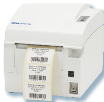
Ausdruck von Barcode-Etiketten mit dem MELAprint 60

Die Autoklaven der Evolution-Serie bieten vielseitige Möglichkeiten für die Dokumentation: angefangen bei der Netzwerk-Einbindung via Ethernet-Schnittstelle, über den Ausdruck von Barcode-Etiketten für die Kennzeichnung verpackter Instrumente bis zur Ausgabe der Protokolle auf die CF-Card.